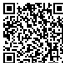
「SNS カウンセリング～ココロの健康相談」 LINE アカウント QR コード