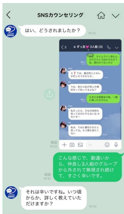
相談画面イメージ

そしてこのたび、厚生労働省の「平成 29 年度自殺防止対策事業 追加公募分」において、本協議会が採択されることになり、厚生労働省より自殺対策 SNS 相談の受託をし、「LINE」を利用した相談事業として「SNS カウンセリング～ココロの健康相談」を実施いたします。同名称の LINE アカウントを開設し、2018年3月1日（木）～3月31日（土）の期間中 18:00～22:00（受付は 21:30 まで）にて、相談を受け付けます。